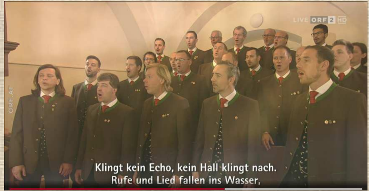
Klingt kein Echo, kein Hall klingt nach. Rufe und Lied fallen ins Wasser,