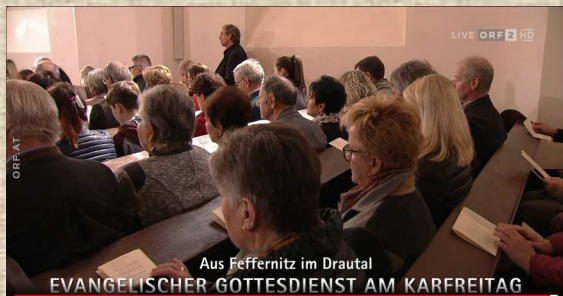
Aus Feffernitz im Drautal EVANGELISCHER GOTTESDIENST AM KARFREITAG